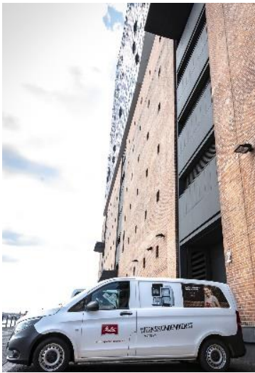
Bild 3: Der Technische Kundendienst von Melitta® Professional im Einsatz in der Elbphilharmonie