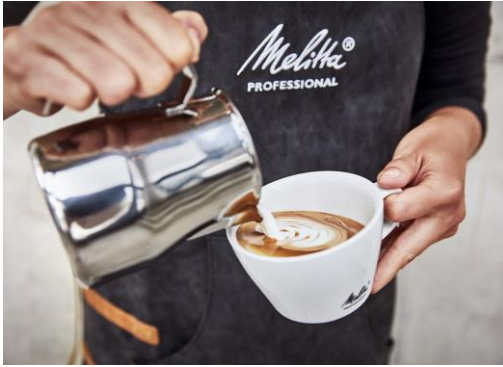
Bild 3: Melitta® Professional begeistert seine Partner in der Welt mit den besten professionellen Kaffee Lösungen.