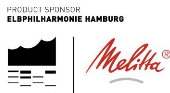
Bild 1: Partnerlogo: Melitta ist Product Sponsor der Elbphilharmonie