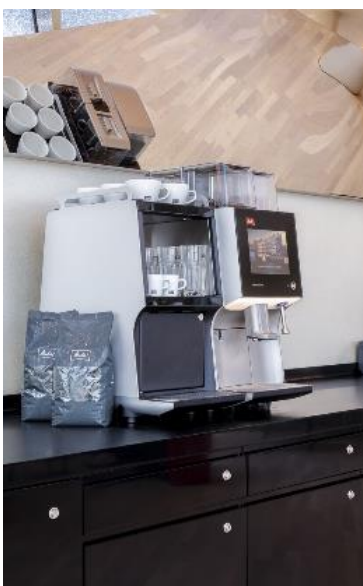
Bild 2: Eine von 17 Melitta XT in der exklusiven Elbphilharmonie Circle Lounge